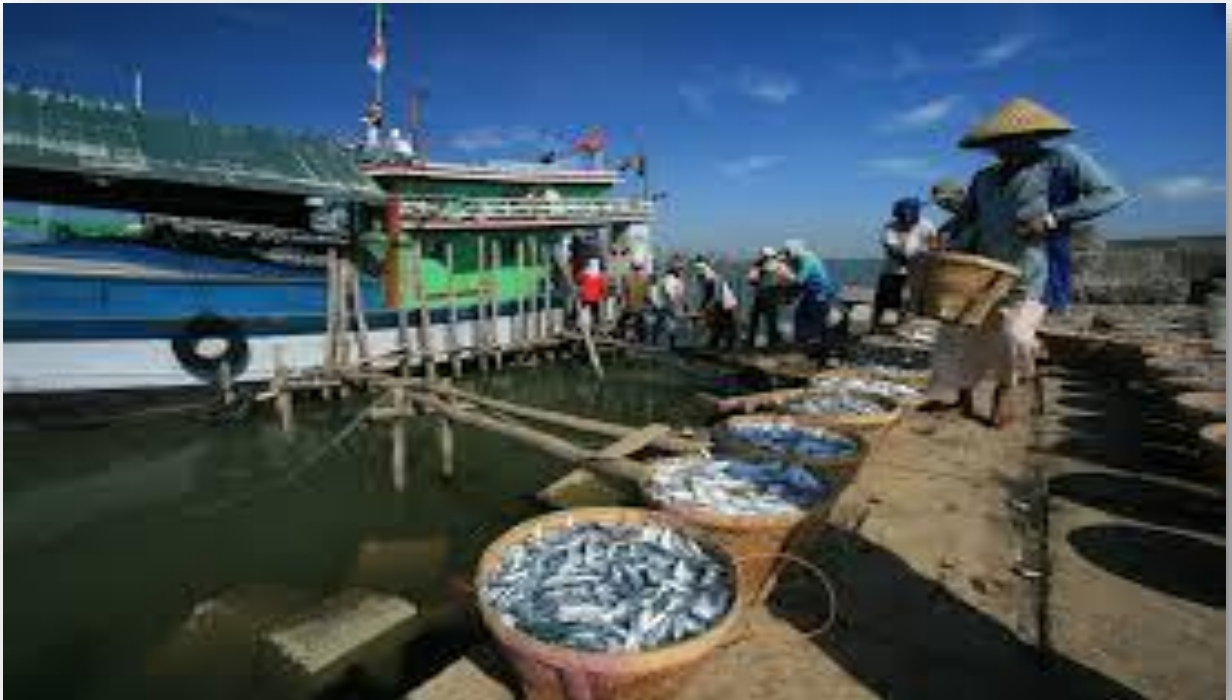
Gambar 2 : Hasil Tangkapan Nelayan

Diskusikan dan Tuliskan kegiatan yang dilakukan nelayan.