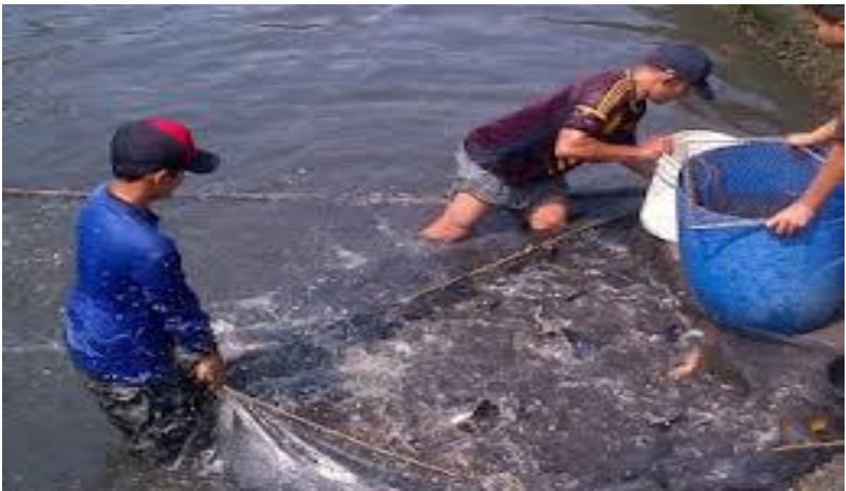
Gambar 8 : Panen Empang

Hasil panen ikan bisa berguna untuk semua orang.