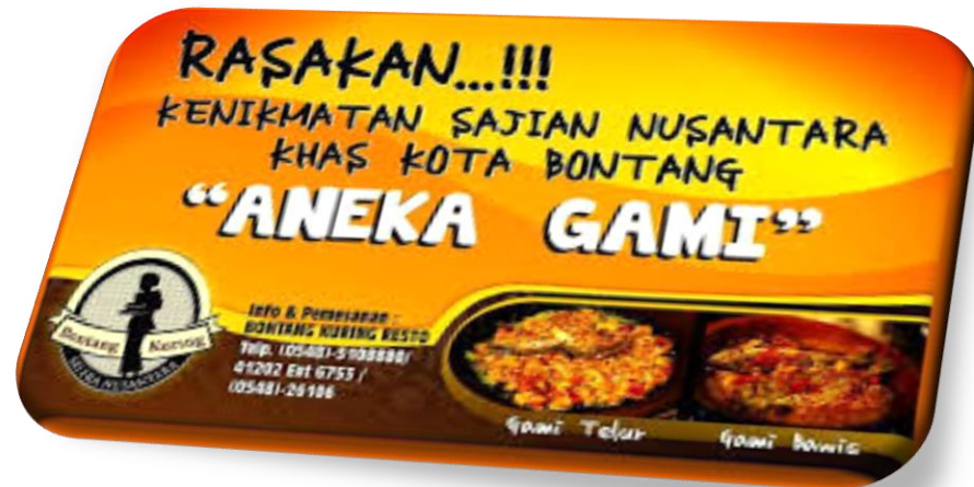
Gambar 13 : Brosur sambal Gami