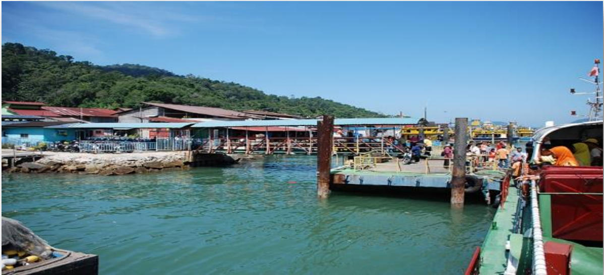
Gambar 1 : Pantai pesisir