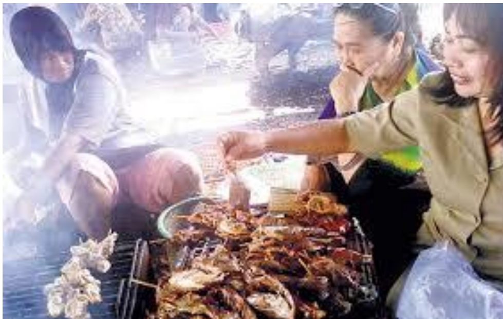
Gambar 9 : Pembuatan ikan asap

Ikan asap ini sudah dijual di pasar-pasar.