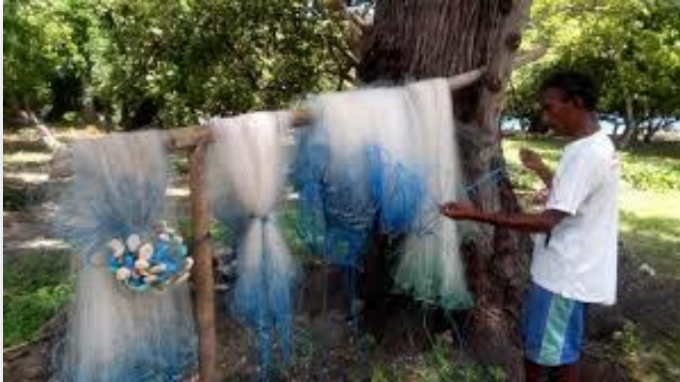
Gambar 3 : Alat Jaring Ikan