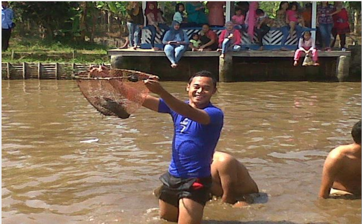
Gambar 7 : Empang Muara Jawa

Diskusikan dan tuliskan kegiatan yang dilakukan nelayan diatas !