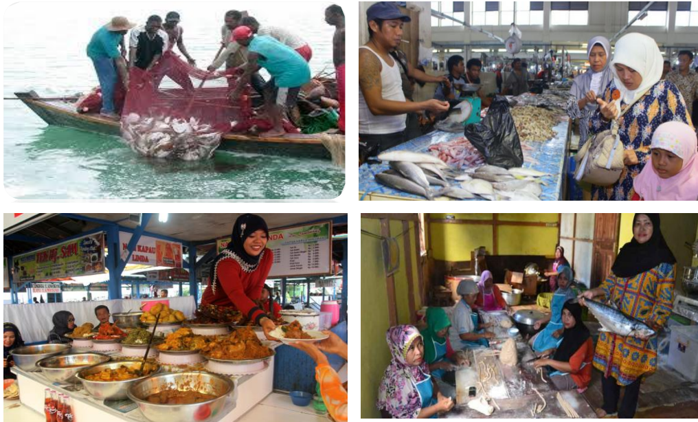
Gambar 10. Hasil melaut dan hasil olahan