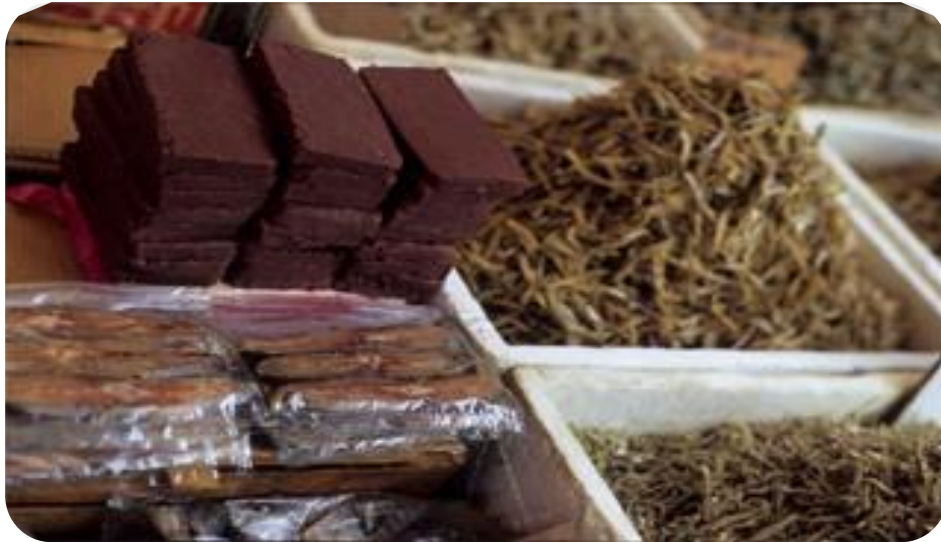
Gambar 11 : Terasi Khas Bontang