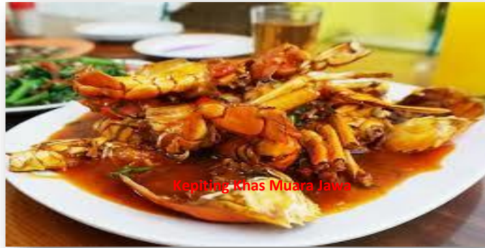
Gambar 5 : Masakan Kepiting Muara Jawa