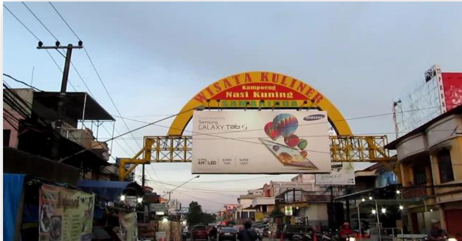
Gambar 6 : Kampung Kuliner Samarinda